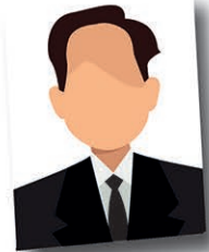
Ruta de Antonio Machado