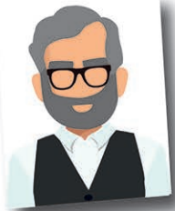
Ruta de Antonio Muñoz Molina