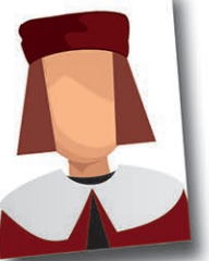
Ruta de Jorge Manrique