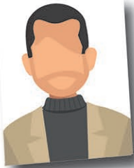
Ruta de Miguel Hernández